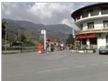
MONASTEROLO DEL CASTELLO (BG) S.S. 42 KM 44+652